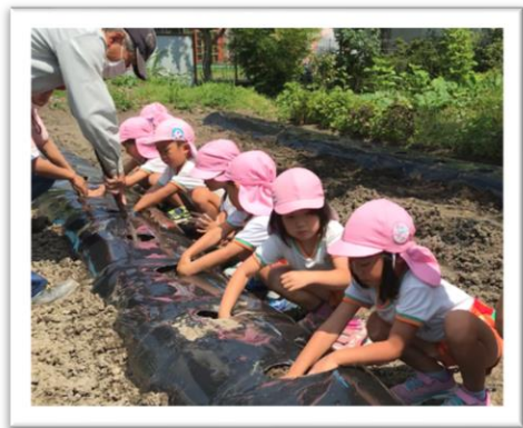
↑さつまいものつるさし（全園児）