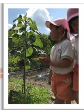
←ひまわりと背比べ