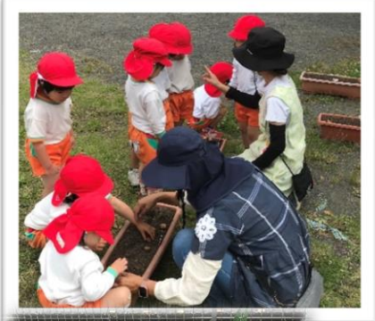
↑グラジオラスの球根を植えたよ （全園児）