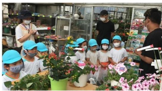
↑さつまいものつるを買いに後藤園にいきました（年長）